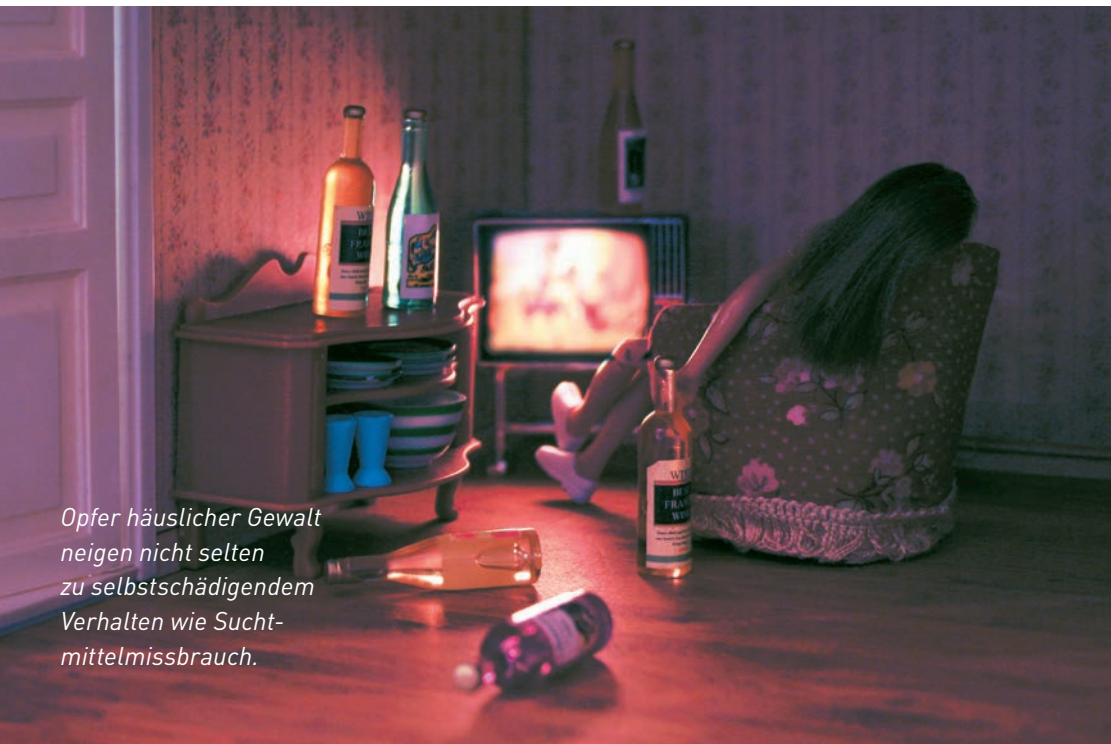
Opfer häuslicher Gewalt neigen nicht selten zu selbstschädigendem Verhalten wie Suchtmittelmissbrauch.

Auch die Gesellschaft trägt die Kosten häuslicher Gewalt mit, die gemäss Untersuchungen jährlich bei einem dreistelligen Millionenbetrag liegen.