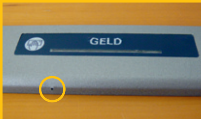
Minikamera (Beispiel) Filmt ungeschützte Eingabe des PIN-Codes.

Als Skimming bezeichnet man das Manipulieren von Kartenautomaten (Geldautomaten, Billettautomaten und Zahlterminals im Detailhandel, an Tankstellen, in der Gastronomie usw.). Dabei bringen die Täter spezielle Apparaturen am oder im Automaten an, die die Magnetstreifendaten von Konto-, Debit- und Kreditkarten kopieren und den PIN-Code ausspähen. Bei der Täterschaft handelt es sich häufig um organisierte Gruppen.