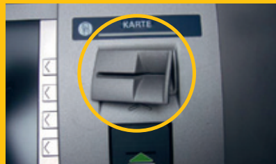
Aufsatz-Attrappe am Karteneinschub (Beispiel) Kopiert Daten des Magnetstreifens.