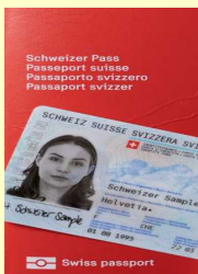
CHP22 und ID23

Das Passbüro des Kantons Luzern ist für das Ausstellen von Schweizer Pässen und Identitätskarten für alle im Kanton Luzern wohnhaften Schweizerinnen und Schweizer zuständig.