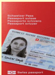
CHP22 und ID23

Das Passbüro des Kantons Luzern ist für das Ausstellen von Schweizer Pässen und Identitätskarten für alle im Kanton Luzern wohnhaften Schweizerinnen und Schweizer zuständig.